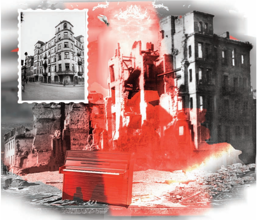
„Piano Heleny - ul. Freta 40, Warszawa, 1945”