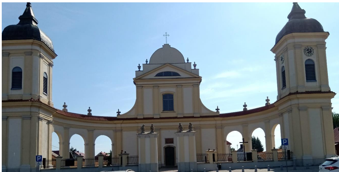
Kościół p.w. Trójcy Przenajświętszej

W kościele p.w. Trójcy Przenajświętszej, została odprawiona msza św., usłyszeliśmy w czasie kazania, że 27 maja 1944 r. wieczorem odbyło się nabożeństwo majowe, w czasie którego modlono się za wszystkich wywiezionych mieszkańców Tykocina.