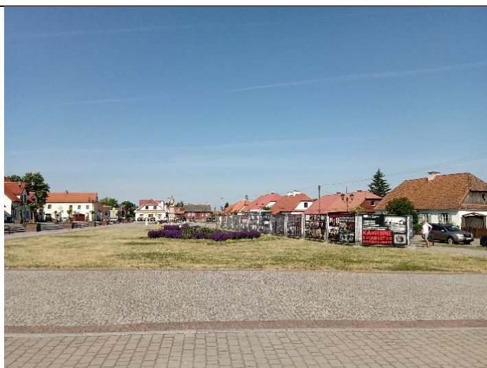
Plac Czarnieckiego w Tykocinie, wystawa „Kamienne Świadectwo”

Dalsza część uroczystości odbywała się na Placu Czarnieckiego. Stoję na trybunie i myślę, że powinniśmy milczeć wobec dramatu, który rozegrał się tutaj 80 lat temu. Patrzę na ten plac, na kościół i próbuję sobie wyobrazić mieszkańców Tykocina 27 maja 1944 roku wypędzonych o 4 nad ranem z domów, przerażonych, stojących na tym placu.